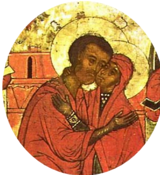
Rencontre de Saint Anne et Saint Joachim

L'entrée se fait par les portes en verre au bout de la rue Pierre Villey (rue qui longe l'église à gauche).